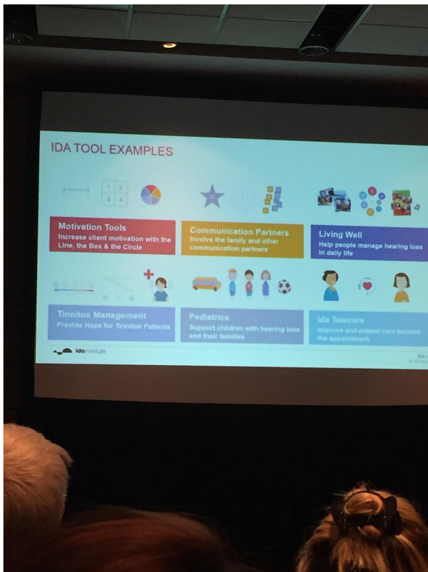
Bild från IDA-institutets föredrag